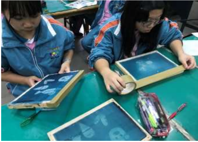
色彩「布」思議：版面整理