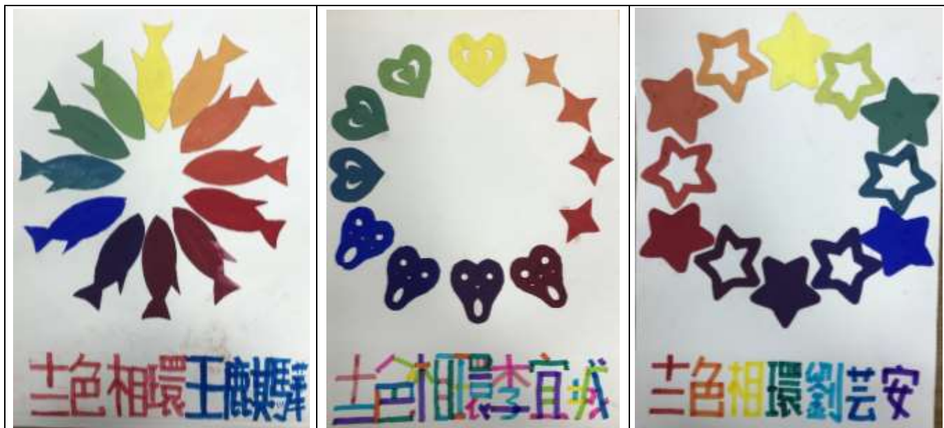
學生作品：三原色-十二色相環調色練習