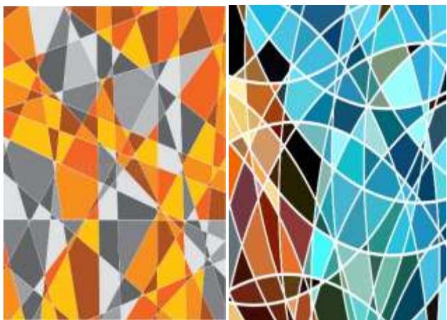
形色構成-不同類型的分割畫面構成介紹