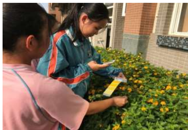
察顏觀色-校園色彩搜查 3