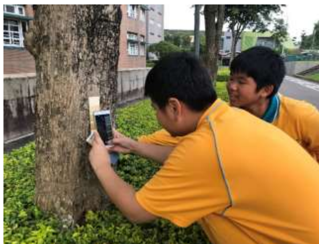
察顏觀色-校園色彩搜查 2