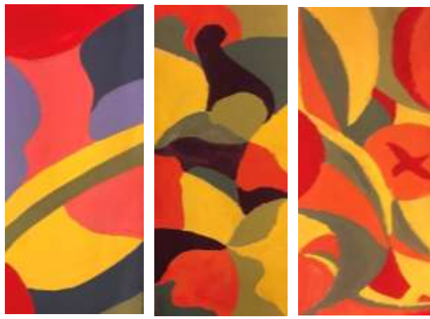
形色構成-校園色彩構成練習