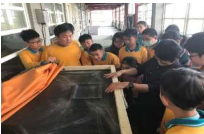
色彩「布」思議：絹版感光機晒圖示範