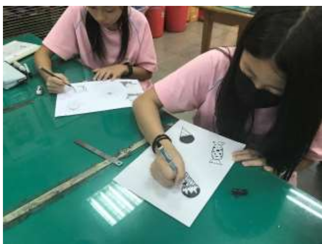
型版圖案的創作與色彩計畫 1