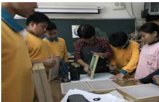
色彩「布」思議：絹版感光乳膠塗敷示範