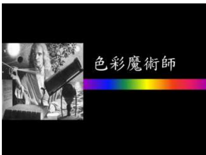
色彩構面鑑賞-色彩魔術師