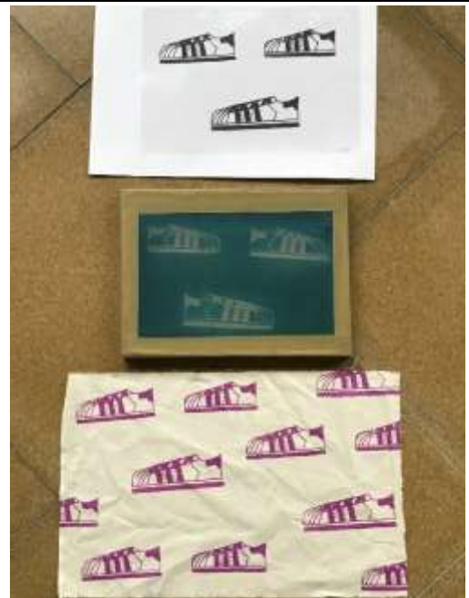
色彩「布」思議：印花布成品