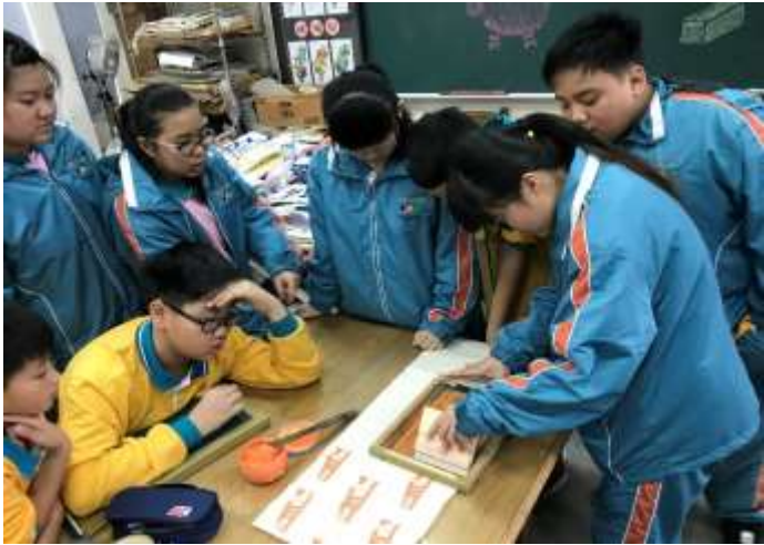
色彩「布」思議：學生印花布實作