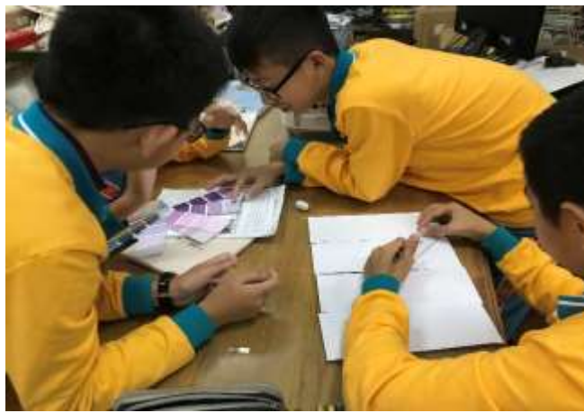
形色構成-校園色彩小組討論與構成練習