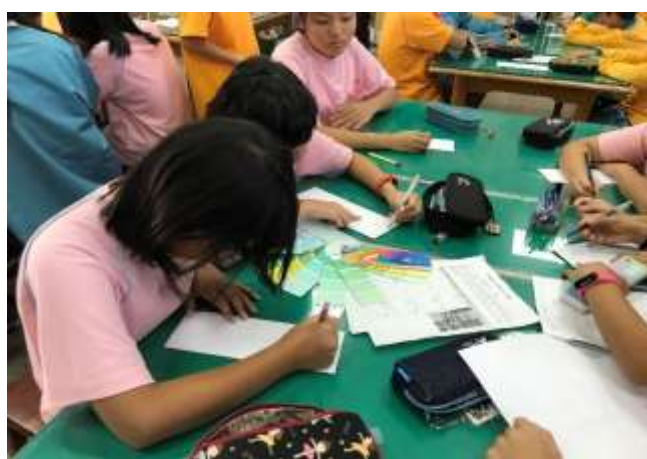
察顏觀色-學習單記錄與討論