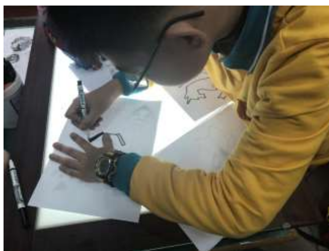
型版圖案的創作與色彩計畫 2