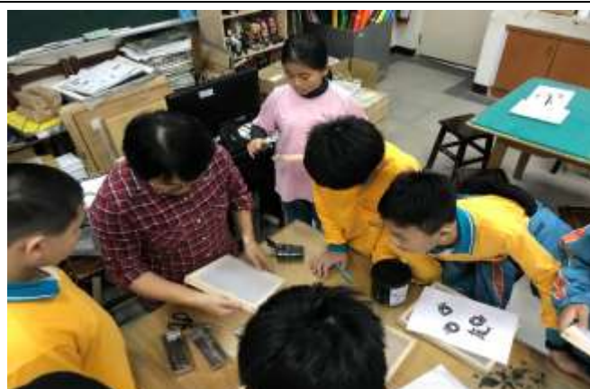
絹版版面整理-修整多餘的線條