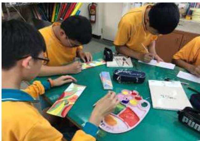
形色構成-校園色彩調色練習