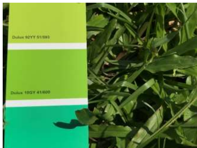
察顏觀色-校園色彩搜查 1