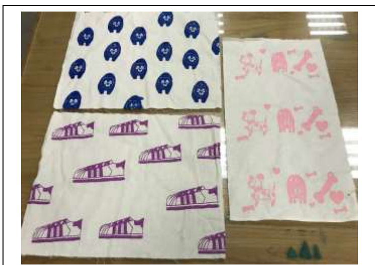
色彩「布」思議：印花布成品

結束六堂的課程，多數學生最有興趣的課程是校園色彩搜查與印花布製作課程，透過各種不同色彩的印製，讓學生探索發現各類有趣的色彩效果呈現，不僅獲得滿滿的成就感也將美感品味得以在生活中持續延伸與展現。