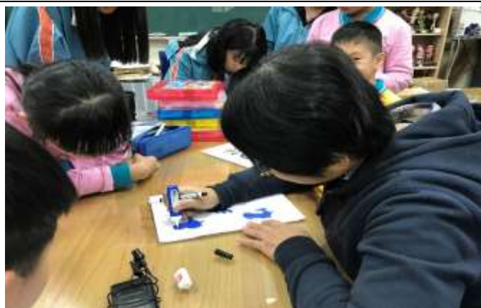
型版圖案確認、修正與投影片製版