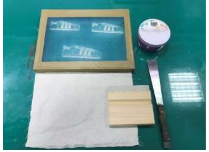
色彩「布」思議：絹印材料介紹與示範