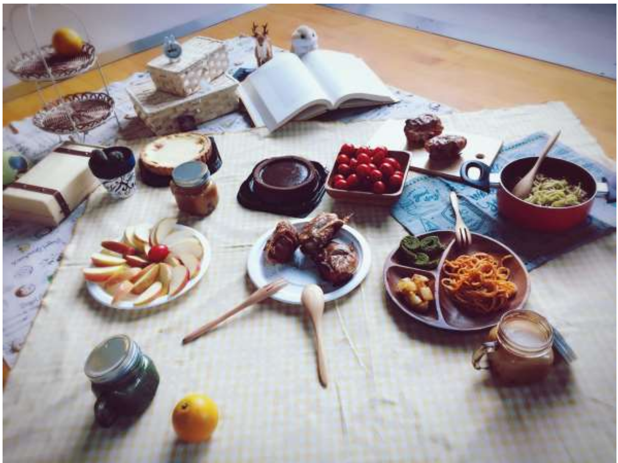
八年級：餐桌設計及桶餐擺盤