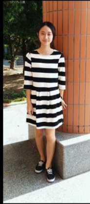
衣飾由蘇怡慧提供