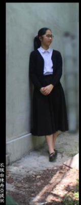
衣決雌雄