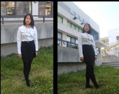
衣決雌雄