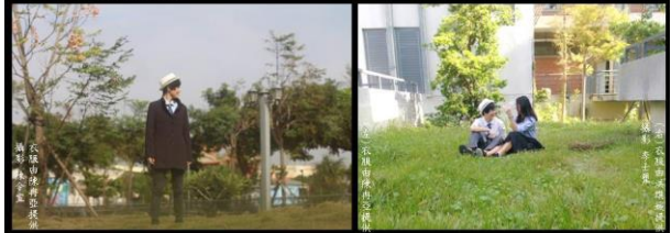
衣飾由潘丹亞提供