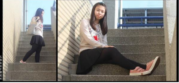
衣飾由潘子云提供