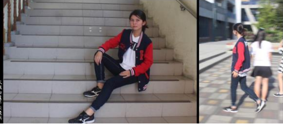
衣飾由潘子云提供