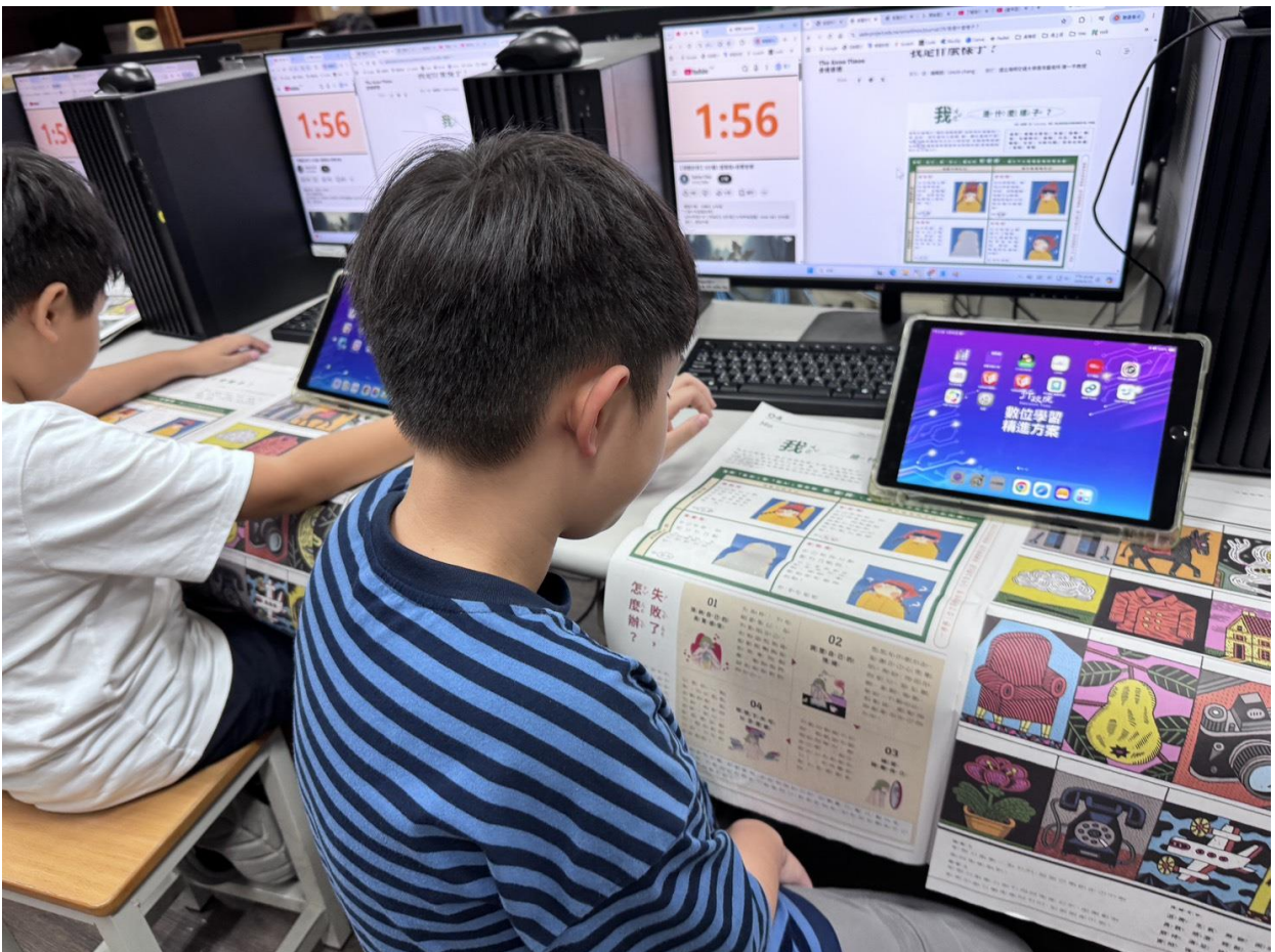
圖一：靜讀三分鐘安妮 123 特刊一 P4，順帶教孩子整理紙本報紙。