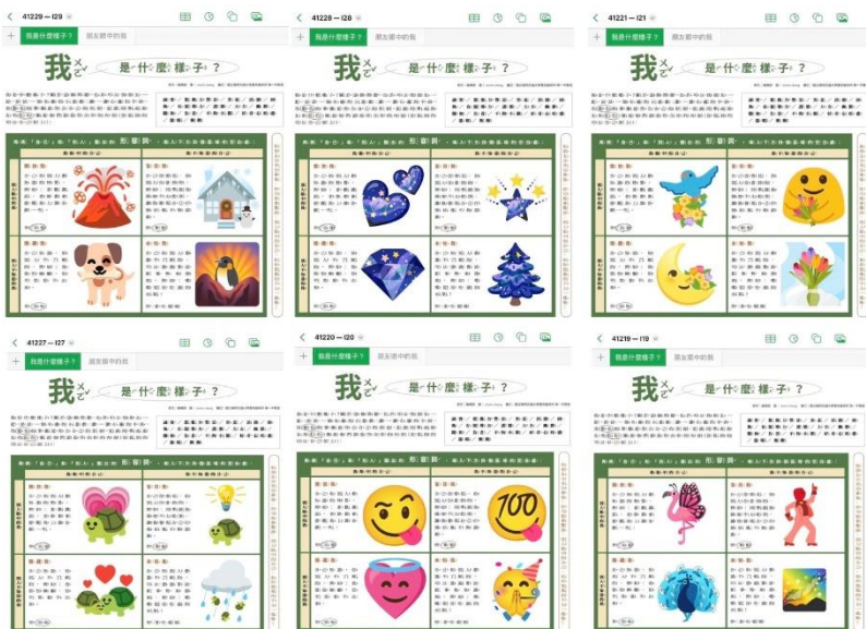
圖十：讓孩子分享「我是什麼樣子？」四格象限圖片。

圖八&九：讓孩子探索 Emoji Kitchen，並讓他們可移動找朋友分享透過他們的圈選而選擇的貼圖。