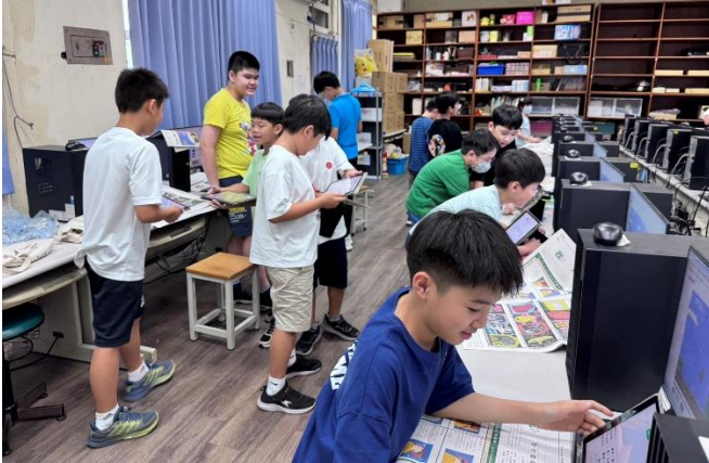
圖二：學生持平板隨音樂移動，音樂停止要找到同儕完成任務。