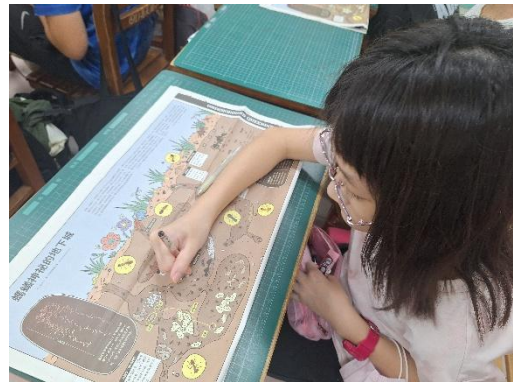
請學生先瀏覽整份刊物版面及內容