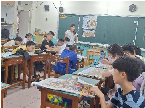
請學生先瀏覽整份刊物版面及內容