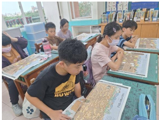
觀看圖片中的細微處