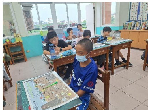
請學生先瀏覽整份刊物版面及內容