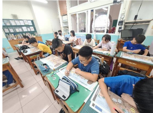
閱讀文字敘述，自己圈出重點或關鍵字