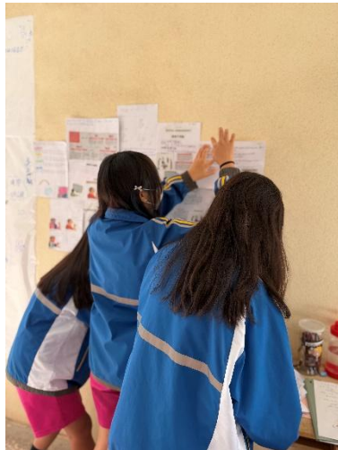
學生貼於牆壁展示