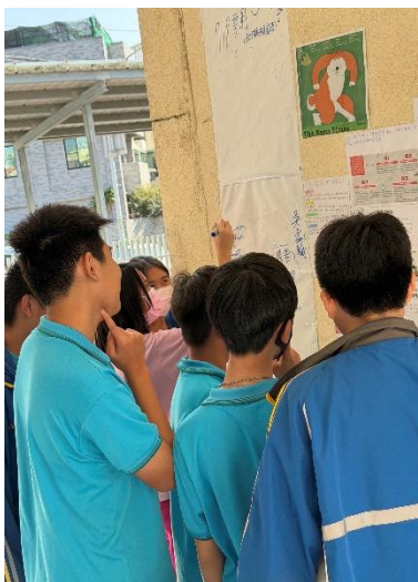
下課時學生會聚集欣賞討論