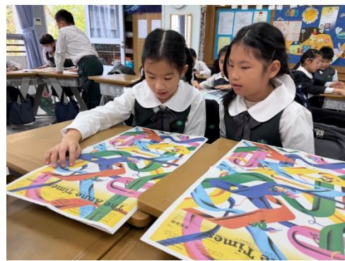
繽紛色彩的世界，你會選擇哪一條路？