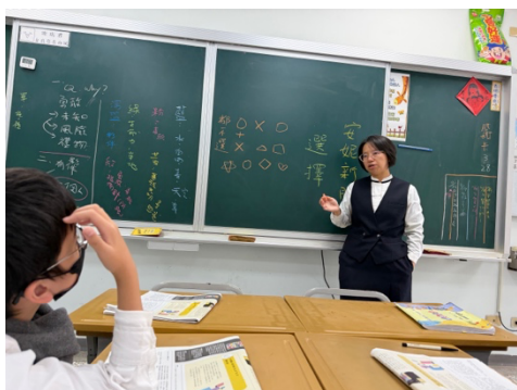
透過師生大量討論，釐清「選擇」的意義？