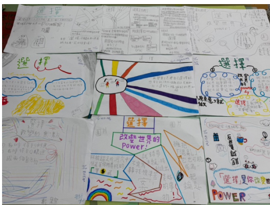
課程海報：學生草稿設計分享。