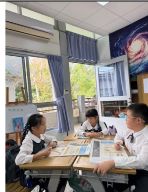
那你覺得呢？為什麼你不敢嘗試？