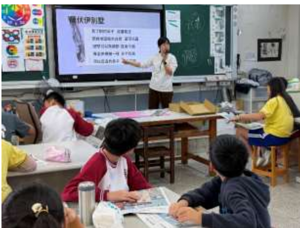
科意建築特色與意義