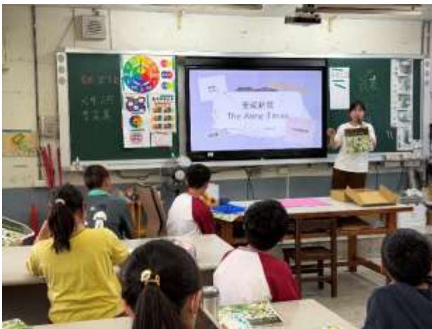
說明安妮新聞報紙的由來與特點