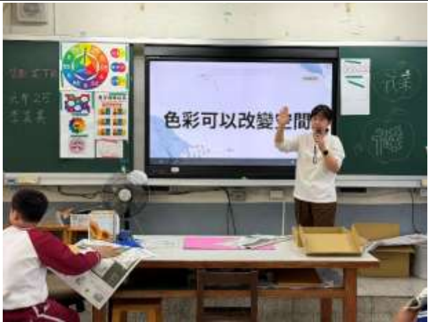
我們可以利用色彩來改造空間