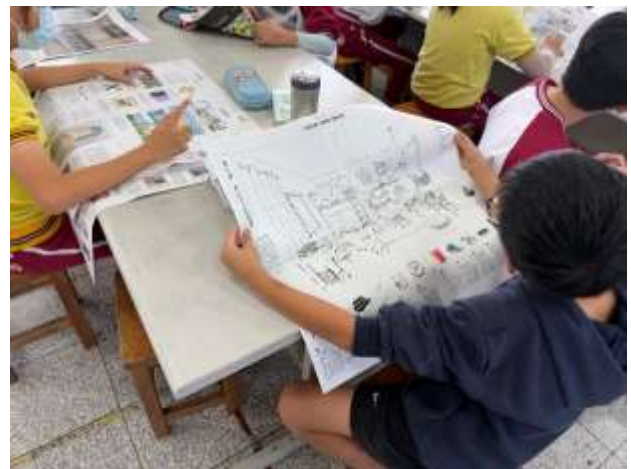
學生概覽性翻閱安妮新聞