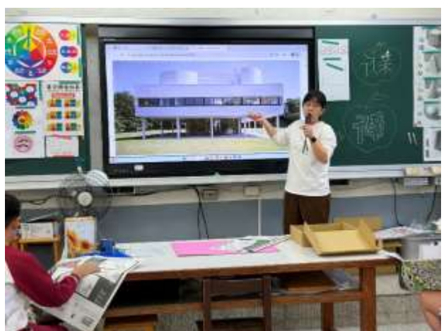
科比意建築實例說明