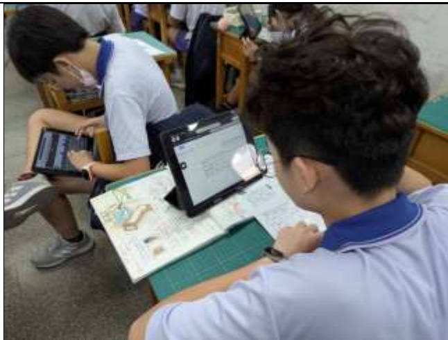
閱讀《安妮新聞》電子報、寫學習單