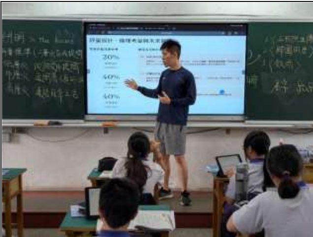
教師介紹三層次提問法