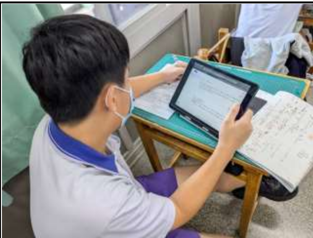
閱讀《安妮新聞》電子報、寫學習單