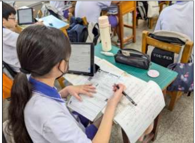
閱讀《安妮新聞》電子報、寫學習單