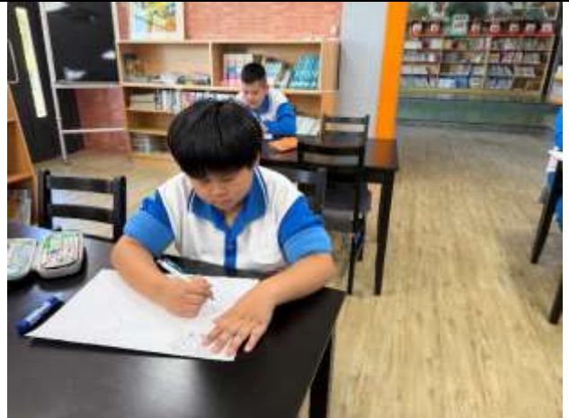
閱讀前的自畫像繪圖