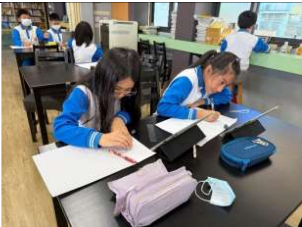
閱讀安妮新聞後自畫像創作