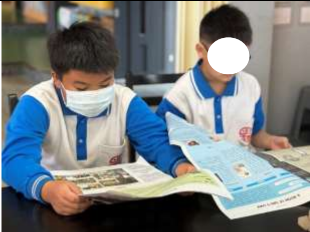
各組進行閱讀與畫重點