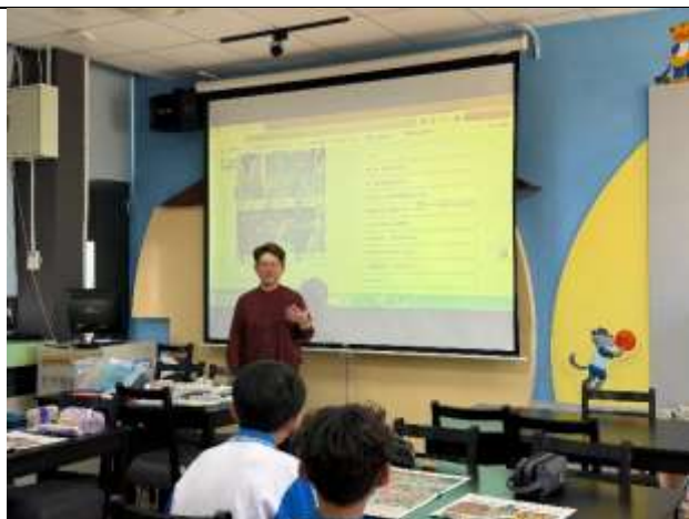
認識安妮新聞刊物列表

教師引導學生閱讀《安妮新聞-美的多重宇宙》，透過個人閱讀與小組討論發表，認識段落與篇章的主旨與個人的想法。