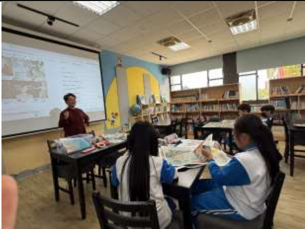
學生對篇章內容的多元性深感興趣