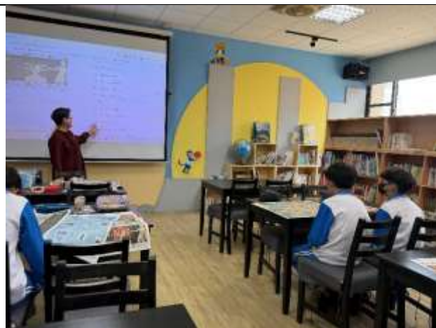
介紹美的多重宇宙的篇章