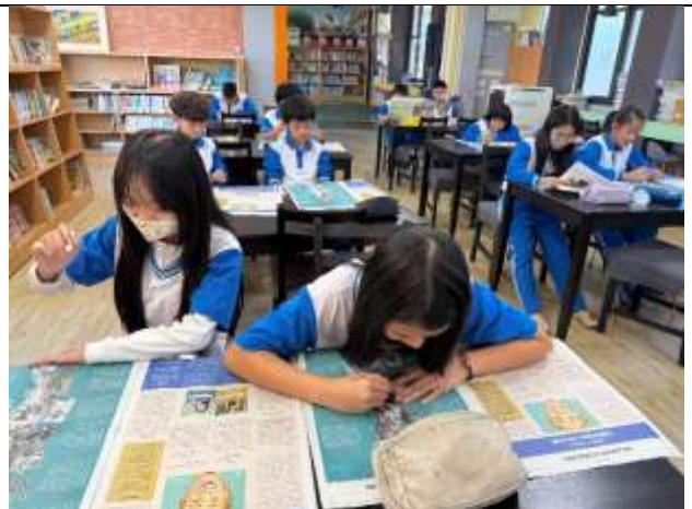
閱讀篇章與畫記重點