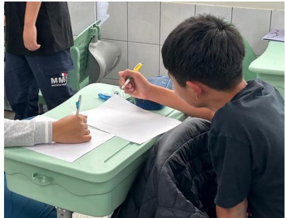
彼此觀察也寫下優點