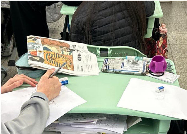
學生閱讀文章後欣賞影片進行活動