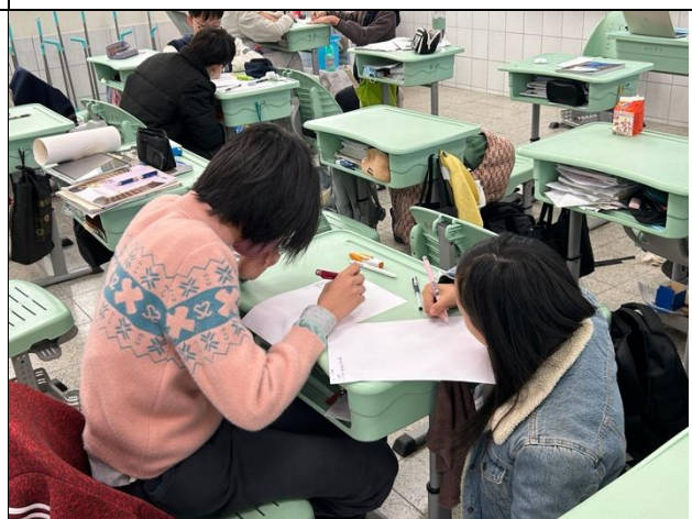
學生可移動到信任同儕座位進行活動