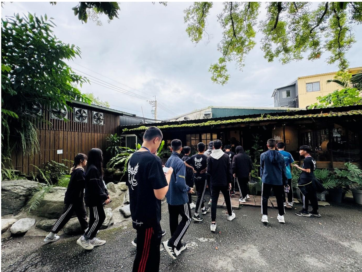
B 學生操作流程：外拍實作