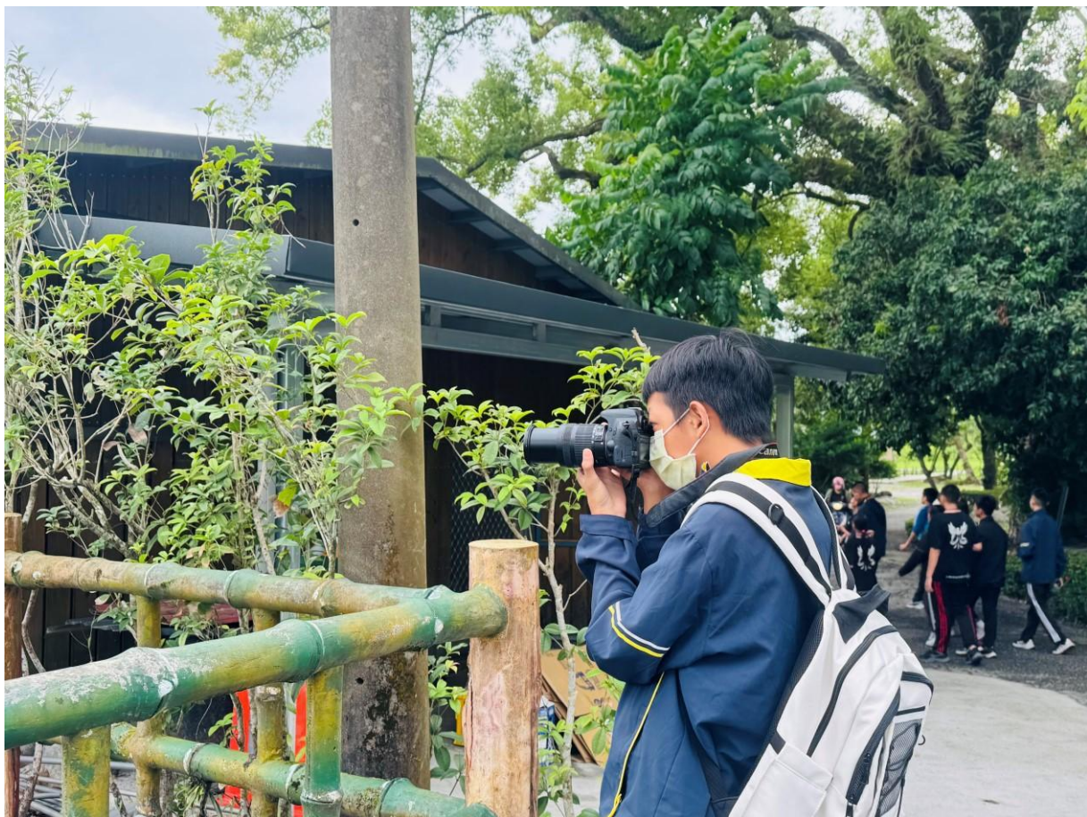
B 學生操作流程：攝影角度 攝影光線的實際操作運用