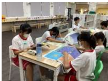
學生讀報進行分享