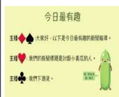
今日最 00 學生作品 2