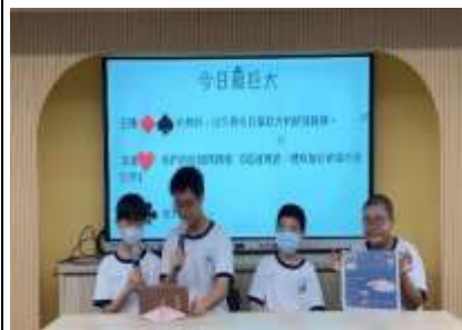
模擬主播進行今日最 00 報導