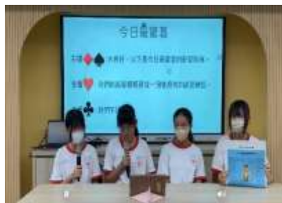
模擬主播進行今日最 00 報導