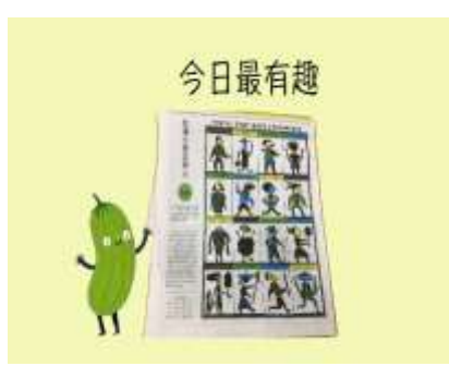
今日最 00 學生作品 1