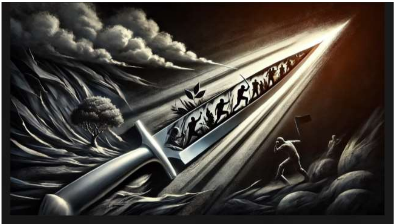
藝術像一把利刃，鋒利而直接的直指社會的問題與黑暗