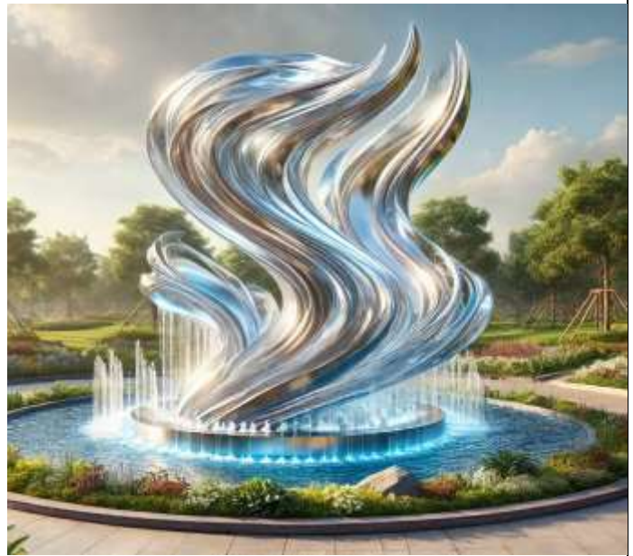
AI 生成公共藝術圖像