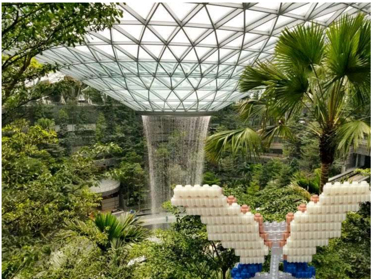
公共藝術與實景數位合成