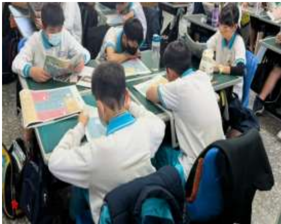
(安妮報紙的閱讀時光)