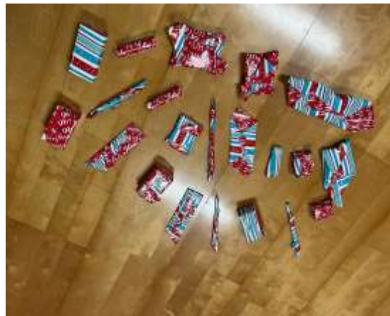
(精心製作的抽獎禮物)