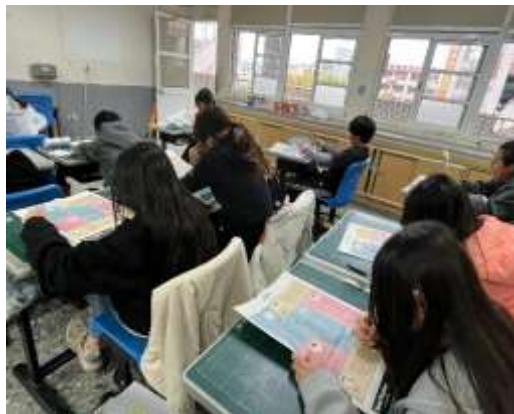
(安妮報紙的閱讀時光)