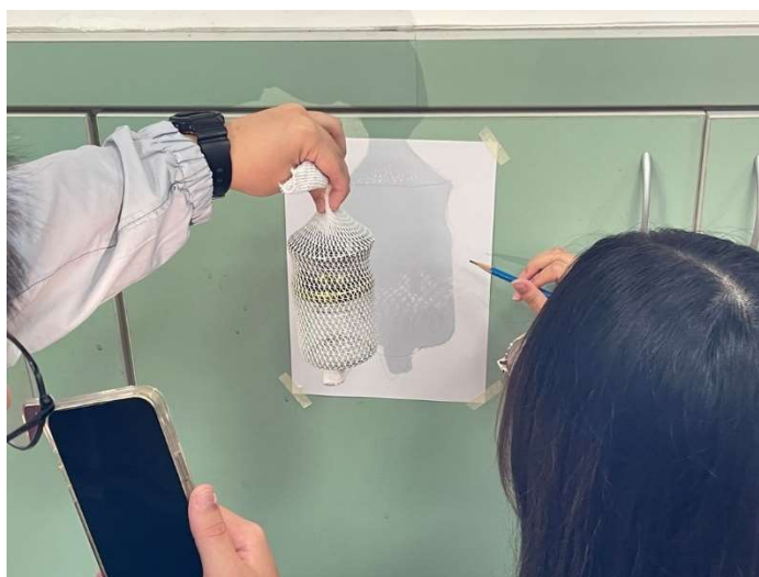
比例 Kit 進行實驗、觀察與記錄