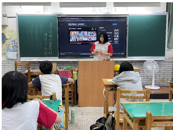
■學生上台分享「關於選擇.....」