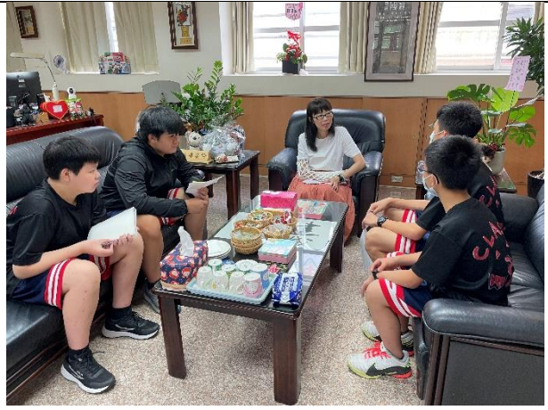
■學生訪問校園大人物