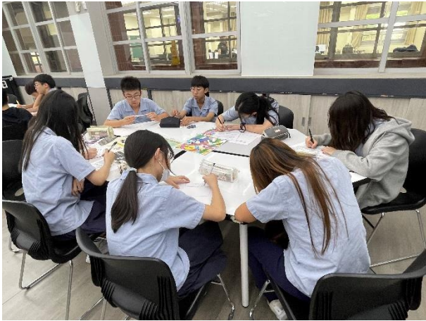
■學生分組討論書寫「選擇」提問的問題